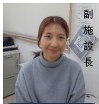
サービス管理責任者