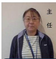
目標工賃達成指導員